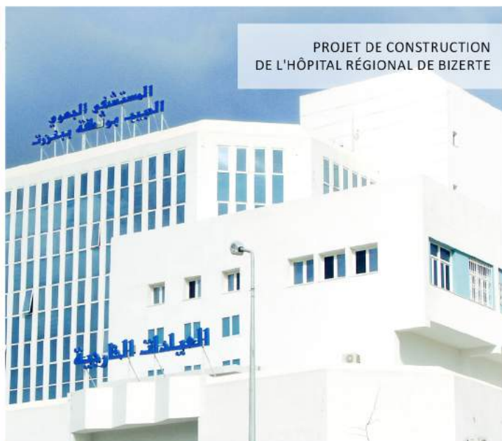
PROJET DE CONSTRUCTION DE L'HÔPITAL RÉGIONAL DE BIZERTE