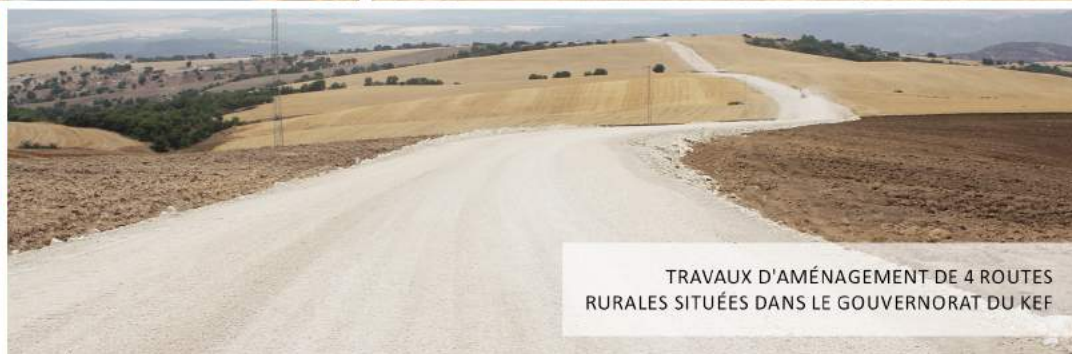
TRAVAUX D'AMÉNAGEMENT DE 4 ROUTES RURALES SITUÉES DANS LE GOUVERNORAT DU KEF