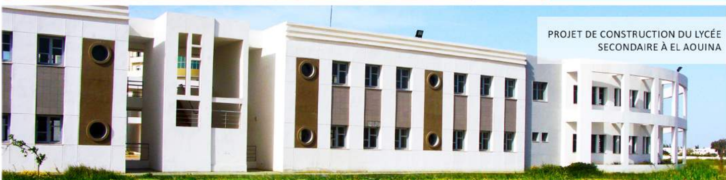
PROJET DE CONSTRUCTION DU LYCÉE SECONDAIRE À EL AOUINA