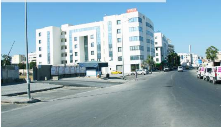
TRAVAUX DE VOIRIE ET DE DRAINAGE DANS LA ZONE « BOURGEL – MONTPLAISIR » EL KHADRA