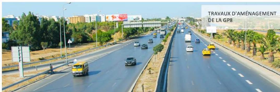
TRAVAUX D'AMÉNAGEMENT DE LA GP8