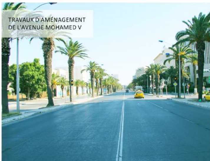
TRAVAUX D'AMÉNAGEMENT DE L'AVENUE MOHAMED V