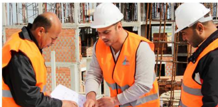
PROJET DE CONSTRUCTION DE 78 LOGEMENTS À BIZERTE