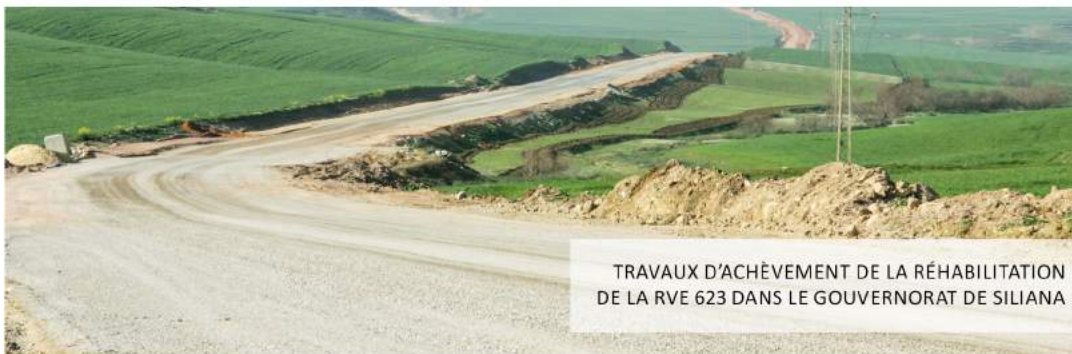
TRAVAUX D'ACHÈVEMENT DE LA RÉHABILITATION DE LA RVE 623 DANS LE GOUVERNORAT DE SILIANA