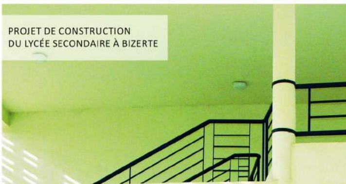
PROJET DE CONSTRUCTION DU LYCÉE SECONDAIRE À BIZERTE