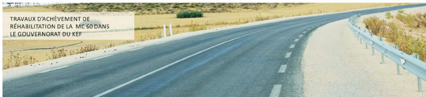
TRAVAUX D'ACHÈVEMENT DE RÉHABILITATION DE LA MC 60 DANS LE GOUVERNORAT DU KEF