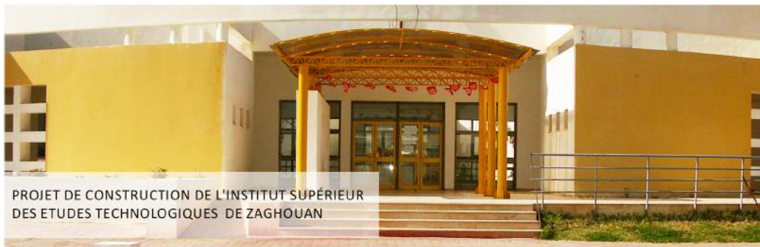
PROJET DE CONSTRUCTION DE L'INSTITUT SUPÉRIEUR DES ETUDES TECHNOLOGIQUES DE ZAGHOUAN