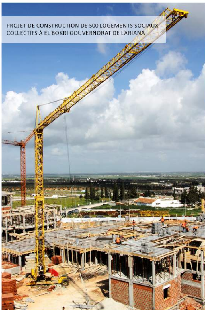
PROJET DE CONSTRUCTION DE 500 LOGEMENTS SOCIAUX COLLECTIFS À EL BOKRI GOUVERNORAT DE L'ARIANA