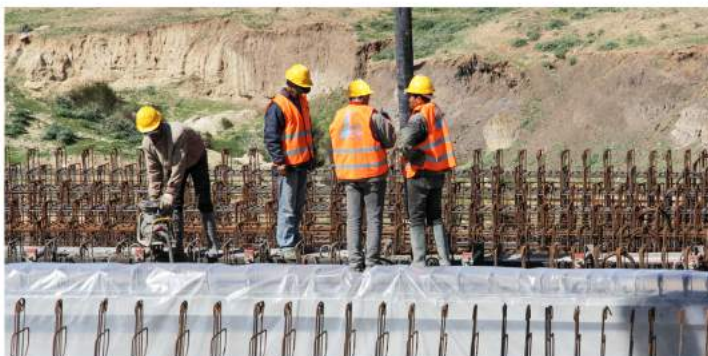
TRAVAUX DE CONSTRUCTION D'OUVRAGE DE FRANCHISSEMENT DE L'OUED TESSA SUR LA MC60 AU PK75,5 DANS LE GOUVERNORAT DU KEF